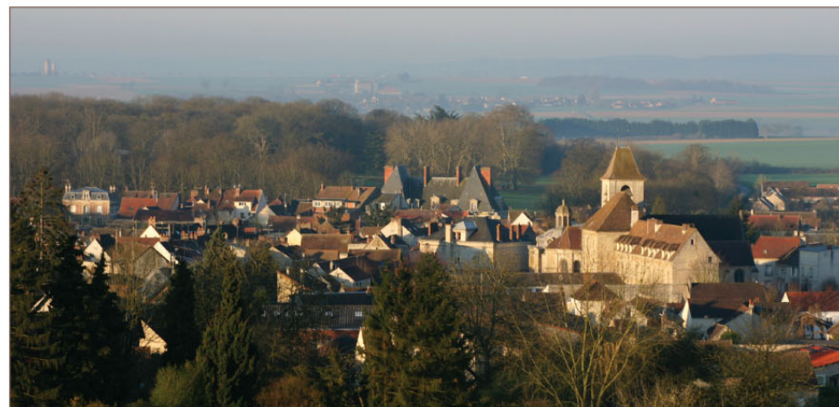
Vue générale de Marines