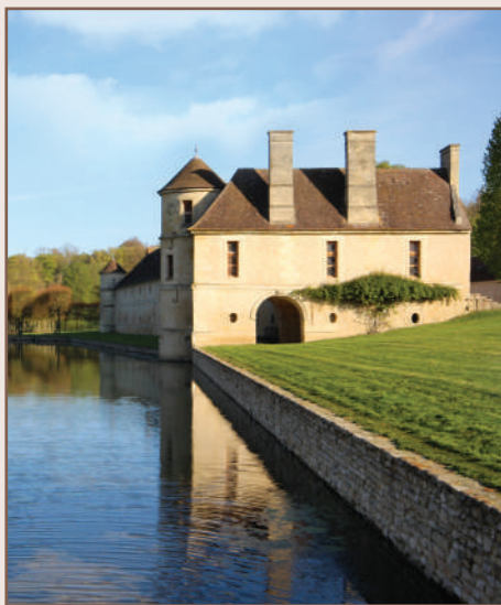
Domaine de Villarceaux