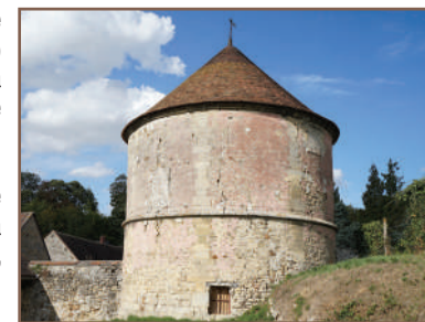
La ferme de Dampont