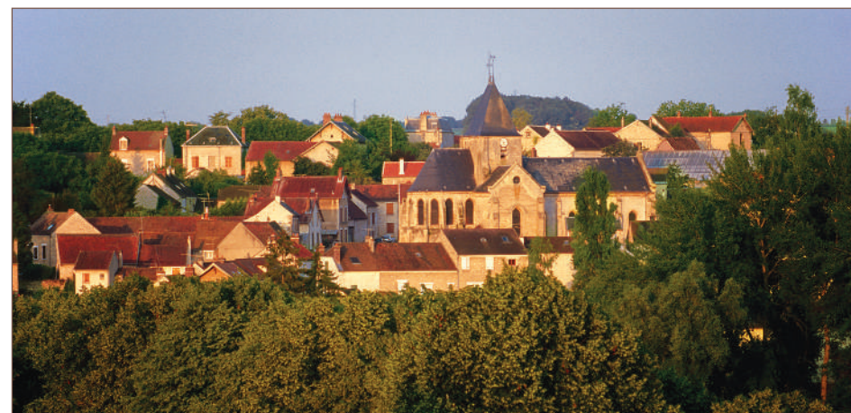
Le village d'Us

FFRandonnée les chemins, une richesse partagée www.ffrandonnee.fr